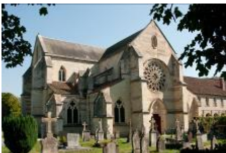
L'Abbaye par Max Chaffaut, adhérent

Son histoire est à peine croyable : malgré la guerre de 1914-1918 qui a fait du village un champ de ruines et ravagé la forêt environnante, comme en témoignent les sites de guerre très connus que l'on peut visiter en forêt sur le territoire de la commune (Ossuaire de la Haute Chevauchée, Nécropole de la Forestière, Ravin du Génie), elle a résisté à la folie humaine et son sonneur ne manque jamais de lui donner vie en marquant tous les jours l'heure de midi.